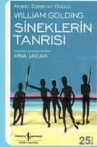
William GOLDING SİNEKLERİN TANRISI