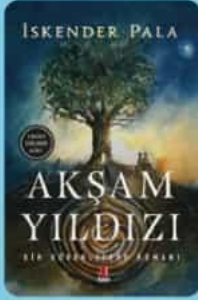
İskender PALA AKŞAM YILDIZI