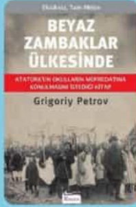
Grigory PETROV BEYAZ ZAMBAKLAR ÜLKESİNDE