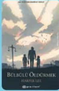
Harper LEE BÜLBÜLÜ ÖLDÜRMEK